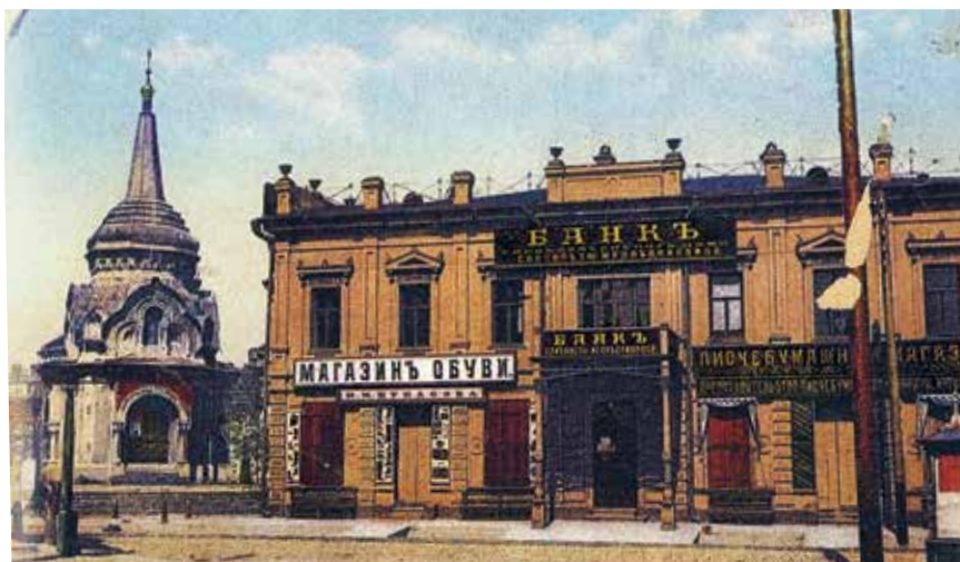
БАНК СИРОПИТАТЕЛЬНОГО ДОМА ЕЛИЗАВЕТЫ МЕДВЕДНИКОВОЙ. ИРКУТСК. ПОЧТОВАЯ ОТКРЫТКА. 1911

К 1 января 1893 года основной капитал Банка Е. Медведниковой составлял 914 043 руб. 15 , а общая сумма, израсходованная