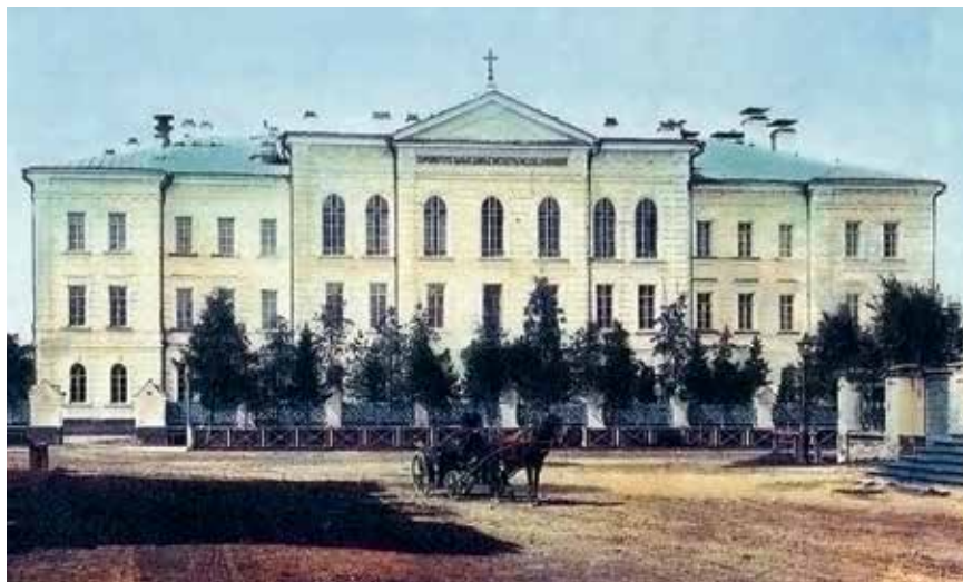
СИРОПИТАТЕЛЬНЫЙ ДОМ ЕЛИЗАВЕТЫ МЕДВЕДНИКОВОЙ. ИРКУТСК, 1900-Е