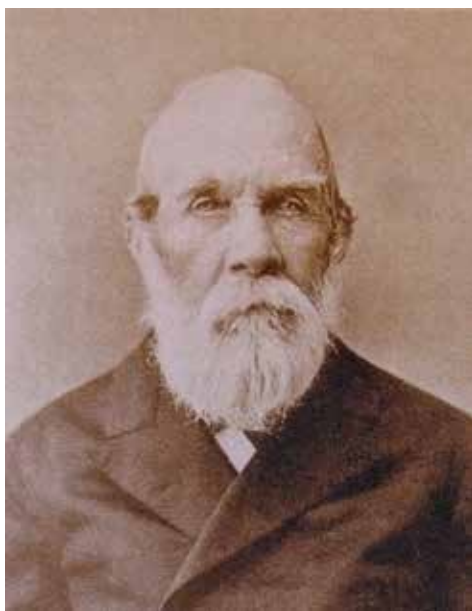
И.Л. МЕДВЕДНИКОВ (1807 – 1889), ИРКУТСКИЙ КУПЕЦ, ПОЧЕТНЫЙ ГРАЖДАНИН ИРКУТСКА

Доходы предполагалось обеспечивать за счет разности между ставками ссуд на торговые обороты под залог имущества «купцам, мещанам и цеховым» (6%) и вкладов (4%). Размер капитала банка не оговаривался. Капитал и документы банка предписывалось хранить в Иркутском окружном казначействе.