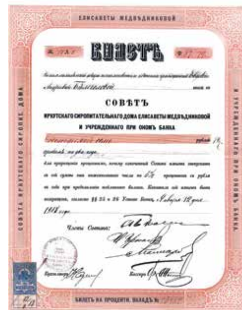
БИЛЕТ НА ПРОЦЕНТНЫЙ ВКЛАД БАНКА СИРОПИТАТЕЛЬНОГО ДОМА ЕЛИЗАВЕТЫ МЕДВЕДНИКОВОЙ. 1916